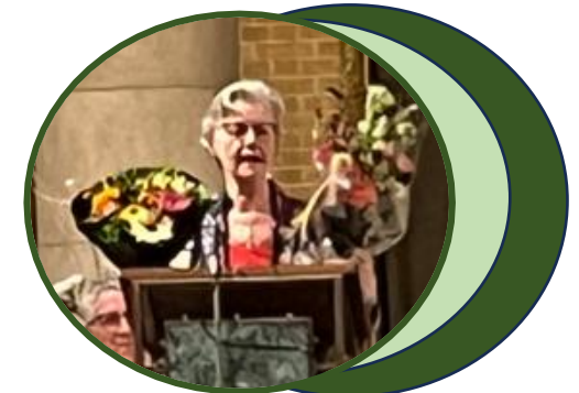
en bloemen van Huis Nederland